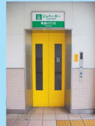
北口 エレベーター