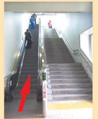
南口 エスカレーター (のぼり専用)