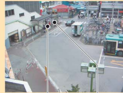
南口 ロータリー東側