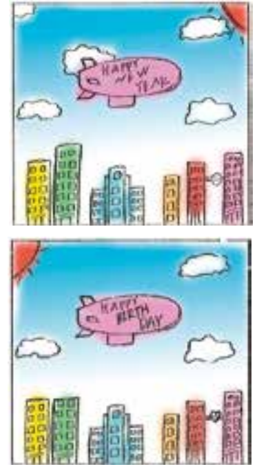
※タッチの違いや色の濃淡はまちがいに含まれません

記念日にちなんでまちがいがし絵をお楽しみください。まちがいはらう。解答はご面下。