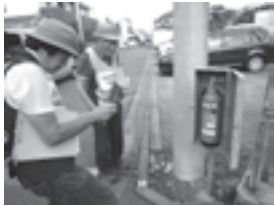
消火器設置場所の確認

講 西東京レスキューバード 内 保谷第二小学校の備蓄倉庫見学後に周辺を約1km歩く。 申 11月2日（金）9時から電話かメールで田無公民館へ