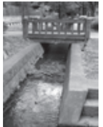
玉川上水にある取水口の跡

玉川上水開通から43年後の元禄年間、1688～1704年に (C) 田無用水 が引かれました。現在の小平市小川町の喜平橋付近で玉川上水から分水。橋場で2つの水路に分かれ、青梅街道北側の水路(本流)は保谷から練馬に入り、田柄川に注ぎ、南側の水路は田無駅東側のガード下付近で石神井川に合流しました。今は、どちらも暗渠化され、それぞれ「やすらぎのこみち」「ふれあいのこみち」になっています。このほかにも小さな支流があり、用水のおかげで、井戸や運び水で維持されていた村人の生活も豊かになったといえます。