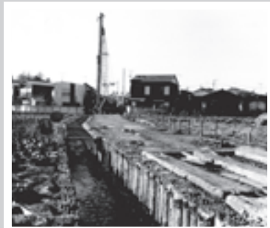
大泉堀(白子川)の改修工事 昭和47年撮影