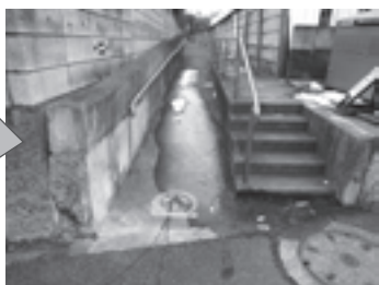
左折した用水路(現在は歩道)

東伏見二、三、六丁目にある下野谷遺跡は、石神井川に面する南側の高台から低地にかけてひろがっています。今から約4000～5000年前の縄文時代中期に、1000年近い長期間にわたり継続して営まれた大集落跡です。集落は日当たりのよい高台にあり、約7m下を流れる石神井川の水量も、当時は豊富だったのでしょうか。石神井川最上流域に位置する内陸の大集落でしたが、丸木舟を使って海辺の集落との交流もあったと考えられます。