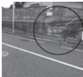
歩道の部分に水路があった

用水の跡をたどると、小平市の方から流れてきた水路は、橋場の手前で90度左折し、青梅街道に出てから橋場に至っています。そこは窪地で、直進すると2mほど下ることになるので、迂回したのではないかと考えられます。