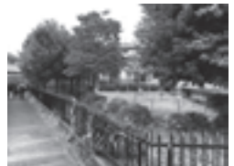
暗渠と白子南公園

大泉堀と新川は、練馬区の井頭池(現在は大泉井頭公園)を源流とする白子川の支流です。ともに窪地の底を走る水路で「シマッポ」とも呼ばれていました。常時水が流れているのではなく、豪雨の後などにだけ水が流れる空堀でした。現在は暗渠になっています。