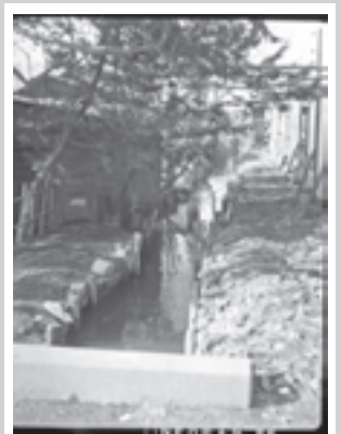
田無用水 現在は暗渠となっている 昭和35(1960)年撮影