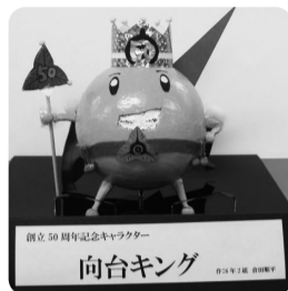
創立50周年記念キャラクター「向台キング」

本校は、昭和34年4月1日、田無小学校の分校としてはじまり、同年7月には新校舎で始業式が執り行われ、翌年の昭和35年4月1日に正式に独立し、向台小学校として開校しました。