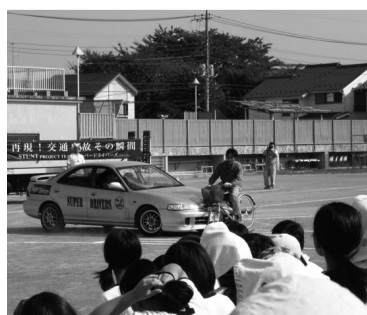
自転車が車と衝突した事故の再現

また、自転車の実技指導では、傘をさしながらの運転の危険性について体験をおして改めて理解を深めることができました。