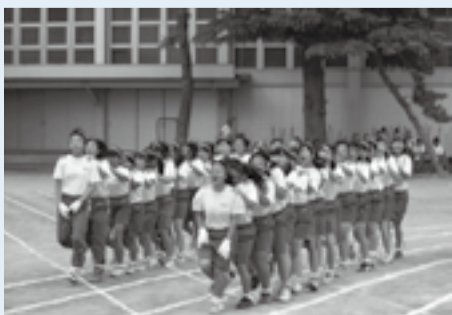
中学校の運動会の様子