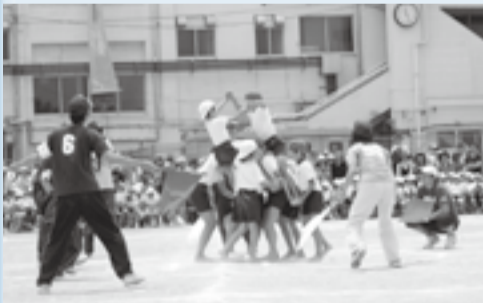
小学校の運動会の様子

教育委員会では、保護者や地域の方々の理解や協力を得ながら、地域全体での教育力の向上を図る取組を推進しています。各学校では、児童・生徒の教育活動などを積極的に公開しております。運動会や展覧会、合唱コンクールなどの学校行事や各々が定期的な実施している学校公開などをきっかけとして、学校への継続的なご支援をお願いします。 1学期に小・中学校21校で行われた運動会では、多くの保護者や地域の方々に子どもたちの活躍をご覧いただきました。