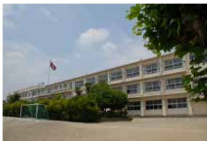
ひばりが丘中学校

中学校8校の理科室、美術室などの特別教室への空調設備整備工事及び小学校15校の特別教室への空調設備設置工事の実施設計を行います。