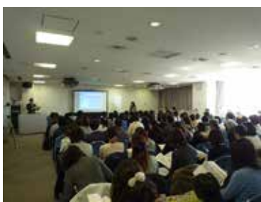
特別支援教室説明会