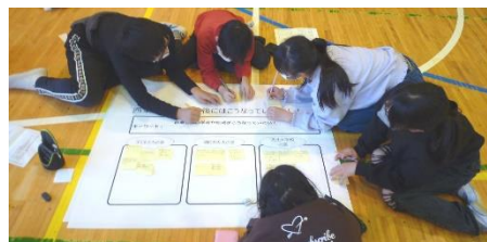
子どもワークショップの様子

本市では、まち全体で子どもの育ちを支えていくことを目的として、「西東京市子ども条例」を制定しました。また、次世代を担う子どもたちのため、「子どもが『ど真ん中』のまちづくり」も進めています。本計画策定を契機に、子どもたちの意見や想いを把握するために、市立小・中学校2校ずつ（計4校）で、子どもが自主的に意見を整理・発表するワークショップを実施しました。