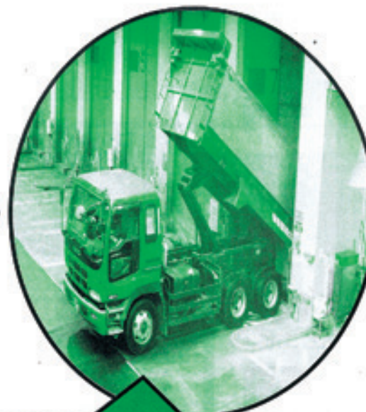
柳泉園(中間処理場)