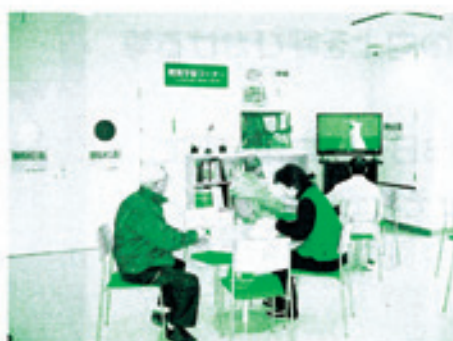
エコプラザ所有のビデオを見ることがもできます