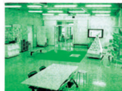
多目的スペース(開放日の様子)