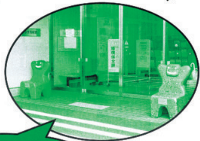
エコセメントいす

西東京市では、11品目にごみを分別しています。次のページに分別品目を掲載しましたので、更なる分別をしていただくようお願いします。