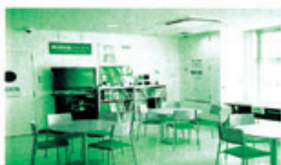
環境学習コーナーの様子