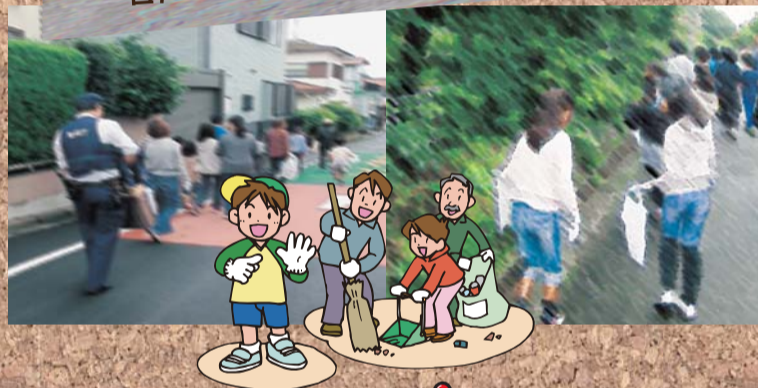
地域環境美化クリーン活動 谷戸二小学校・碧山小学校・栄小学校

各学校の取り組みには、独自の工夫があり、クリーン活動に加え、防犯対策・防災訓練、出前講座なども行われています。