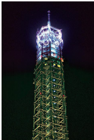
ライトアップ：晴れ（紫）

スカイタワー西東京は平成元年に建設された。当時は通信自由化に伴い、首都圏の電波・無線の利用が急拡大したため、マルチメディアタワーと呼ばれる電波塔としてニーズに応えた。その愛称を社名に冠する株式会社田無タワーは同年に設立され、公共防災・救急、携帯電話会社、タクシー会社用無線など、多くの無線通信利用者にアンテナ・無線機の設置施設を提供すると共に、その管理運営を担ってきた。