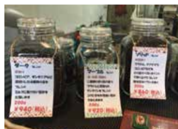
焙煎工房で販売しているコーヒー豆。ダークブレンドは200グラム940円(税込)。プレッツァ珈琲のフェイスブックからも購入できる

甘味があるケニア産や、軽い口当たりで優しい薫りのエチオピア産などのアフリカ系を中心に、中南米やアジア産などの厳選した豆をブレンドしている。