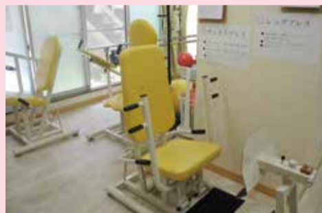
リハビリ機器各種

業療法士が中心となり、個々の状態に合ったリハビリメニューを作り、9種類のマシンなどを使って機能改善を促す。一方、昼食は専門調理師が作り、主菜は6種類の中から選べる。 脳トレ強化型デイサービス「すきやきII」では、絵画、ピ