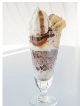
黒米とおしょうゆのパフェ

最後に興味を持たれた方にと一言 いただいた。「形のないものが形のな いままでもなんとなく分かる。ぜひ それを探しに来てみてください。」直 感のままに足をお運びあれ。