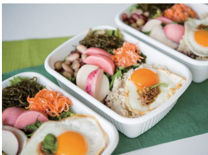
自家製塩こうじのガバオライス

「なおきち」各店では飲食のほかに独自のイベ ントが楽しめる。自家焙煎珈琲が自慢の「田無な おきち」では、絵本の読み聞かせ、落語、占い、座禪、 お悩み相談まで幅広いイベントが催されている。 多摩六都科学館内「六都なおきち」では定期的に “大人のハーブ講座”を開催。吉祥寺シアター内 「吉祥なおきち」では、お芝居を見に来たお客様 に特製健康食やアートギャラリーで迎える。田無 神社境内の珈琲屋台「風薫る 神社なおきち」では、