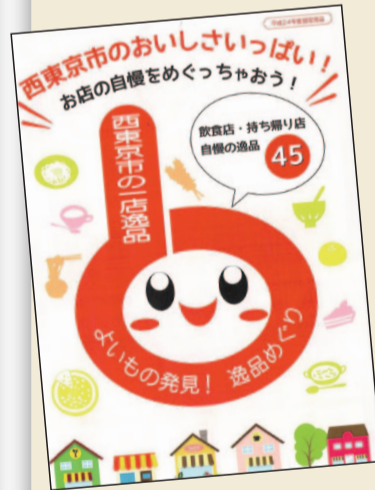
「西東京市の一店逸品 よいもの発見! 逸品めぐり」の冊子。

西東京市では、西東京商工会と協力して、モノやサービスなど個店独自の「逸品」を確立し、入りたくなる店づくりへとつなげる「一店逸品事業」を平成24年度からスタートしています。 逸品は、商工会で組織する選考委員が、商品の試食や店舗訪問により、お店の雰囲気や店主の意気込みなどを中心に選考を行い、認定します。 第1弾(平成24年度)では、食品関係の業種を対象に逸品を認定し、第2弾(平成25年度)では、物販販売業・サービス業・ものづくり業などを対象に逸品を認定しました。認定された逸品は、紹介冊子やスタンプラリー、イベント出店などを通じて市内外にPRを行っています。