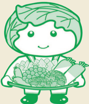
西東京市農産物キャラクター「めぐみちゃん」