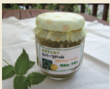
「プチ果房ヴァリエ」の「ルバーブジャム(夏みかんピール入り)」