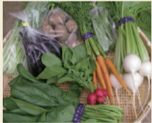
西東京市内産の多彩な農産物