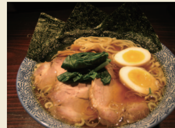
飲食店部門のグランプリに選ばれた「中華そば 一丸(かずまる)」の「一丸 中華そば」

一店逸品事業の詳細は、西東京商工会が運営する一店逸品事業専用ホームページをご覧ください。