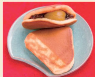
お持ち帰り部門のグランプリに選ばれた「お菓子処 吉乃」の「栗どら」

平成26年度は、第1弾で認定した食品関係の逸品を覆面調査員や市民投票などにより採点する「逸品グランプリ」を実施したほか、第2弾で認定した物販販売業・サービス業・ものづくり業などの逸品を紹介する冊子の作成・配布を行っています。 また、第3弾として、再度、食品関係の業種を対象とした逸品の募集を行います。