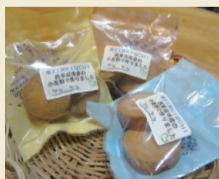
「菓子工房 KIOCHI」の「西東京市産小麦のクッキー」

めぐみちゃんメニュー事業の詳細は、専用ホームページ：【たっぷり“畑”の恵み～西東京市 農のあるまちサイト～】をご覧ください。メニューの内容のほか、実際に使われている農産物や生産されている農業者の方の情報もご覧いただけます。