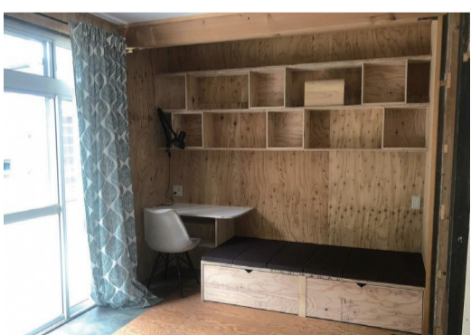
押し入れをDIY型リフォームしたスペース

「住み手に寄り添った工務店でありたい。」という想いは変わらず、先の読めない時代でも、情報収集とニーズに合わせた臨機応変な対応で、引き続き、西東京市周辺の暮らしを豊かにしていく。