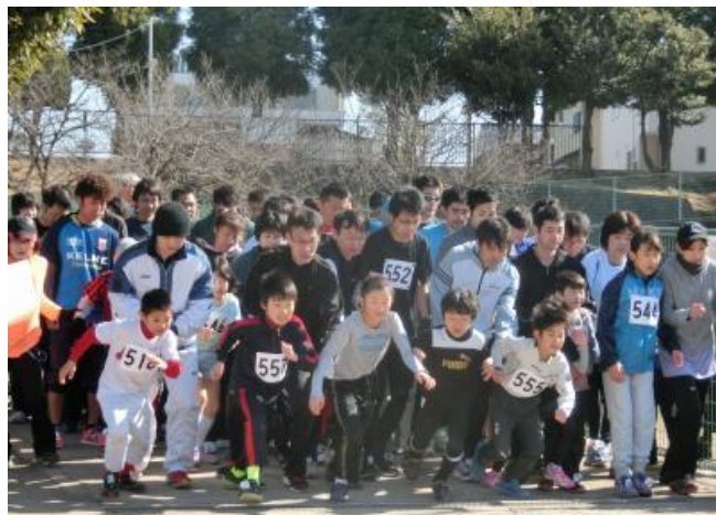
昨年の様子【1 km親子スタート】