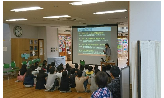
タバコの影響について保健師などが説明