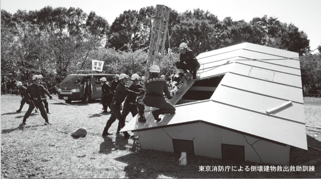
東京消防庁による倒壊建物救出救助訓練