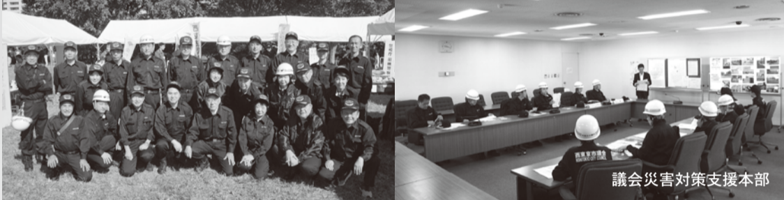
議会災害対策支援本部