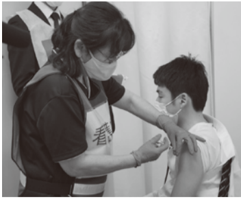
ワクチン接種会場模擬訓練の様子

問 非接触型決済による感染症に強いまちづくりへ、キャッシュレス決済ポイント還元事業を提案した。感染症の最前線で働くエッセンシャルワーカーへの応援事業とあわせ、概要を伺う。