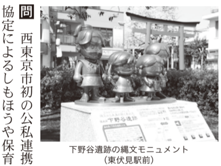
下野谷遺跡の縄文モニュメント(東伏見駅前)

問 温室効果ガス実質排出ゼロへの取組を伺う。次期計画で、脱炭素社会への転換を位置づけるべき。