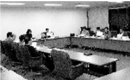
議会報編集委員会

この2年間は、議会も多忙を極め、まさしく激動の2年間であったといえます。その動きをいかに皆様にかかりやすくお伝えするか、編集委員一同努力を重ねてまいりましたが、ご満足いただけたでしょうか。議員の改選により、編集委員会メンバーも一新されることになりましたので、現在の編集委員会によりお届