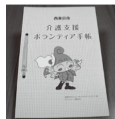
介護支援ボランティア手帳 (60歳以上、説明会等受講者に交付)