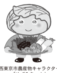
西東京市農産物キャラクター 「めぐみちゃん」