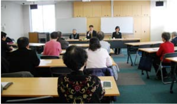
パリテまつり講座