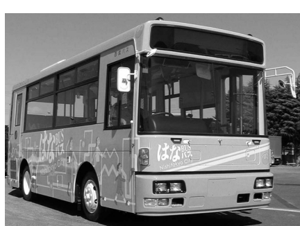
コミュニティバス「はなバス」

さらに、西東京市の長期的かつ計画的な行政運営を推進することを目的として、西東京市総合計画を平成15年度を目途に策定してまいります。総合計画は、新市建設計画の重要性を勘案し、それとの整合性を図るとともに新たなニーズを踏まえて策定する方針としており、現在、計画策定に向け、総合計画策定審議会でご審議をいただいているところであります。平成13年度では、人口推計、市民及び職員意識調査の実施など、計画策定のための基礎的情報の収集を中心に進めてまいりましたが、本年度は、市民や小・中学生を対象にしたワークショップなどを開催し、幅広い層の意見の集約に努め、計画に反映してまいります。