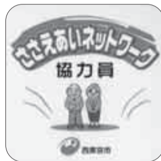
〈ささえあい協力員の目印ステッカー〉