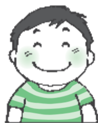
ママがいなくても安心だよ。