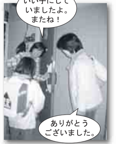
いい子にしていきましたよ。またね！