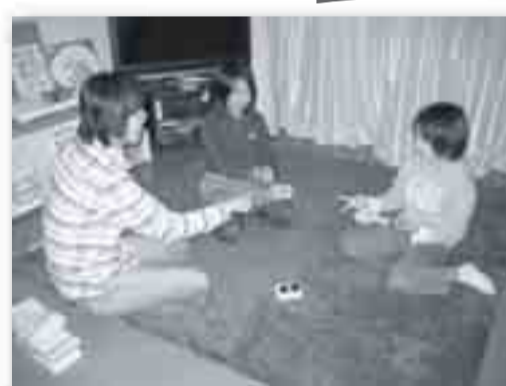
いっしょに遊びながらママの帰りを待ちます。