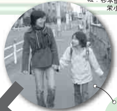
サポート会員さんが迎えにきてくれました。