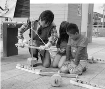
みんなに大人気の火おこし