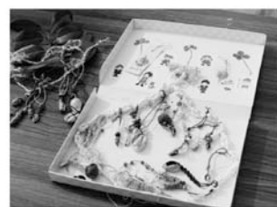
縄文人が大好きな貝のアクセサリー

時 10月7日(日)午前10時～午後4時 (雨天時は10月8日祝) 場 下野谷遺跡公園(東伏見6-4)