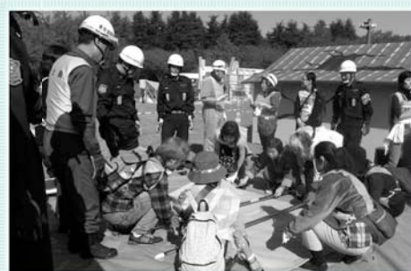
地域で行う防災訓練

西東京市が現在把握している市内の自治会・町内会は232組織です。まだ市に届け出をしていない自治会・町内会は、ご連絡ください。また、自治会・町内会への加入をお考えの方も、協働コミュニティ課までご連絡ください。