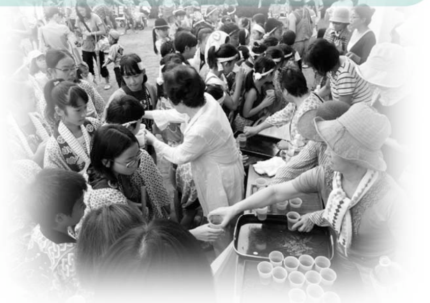
ふるさと祭りを通じた地域交流の活動

「西東京市地域コミュニティ基本方針」は、両庁舎1階情報公開コーナーに設置しています。また、市HPでご覧いただけます。