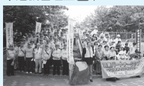
まちの安全を見守る皆さん

今後も皆さんの力で安全・安心なまちをつかっていきましょう。秋の全国地域安全運動期間にも合同パトロールを実施しますので、ぜひご参加ください。 ◆危機管理室保(☎042-438-4010)