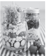
メイソンジャーサラダ