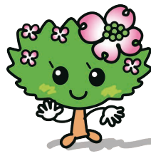
市の花キャラクター はなみずき