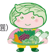
西東京市農産物キャラクター「めぐみちゃん」