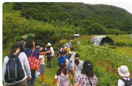
親子バス見学会の様子