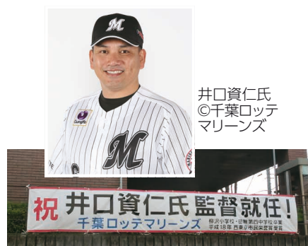
井口資仁氏 ◎千葉ロッテマリーンズ