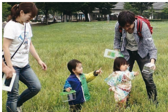
チョウがとれたよ!