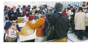
オープン直後の会場(前回)