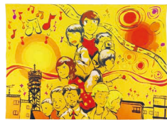
平成29年度の最優秀賞作品