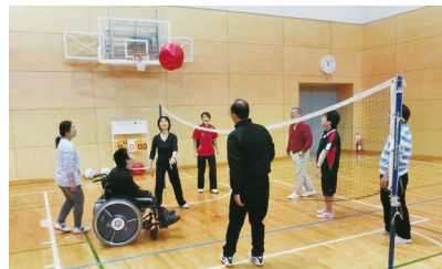
障害のある方も楽しめるバルーンでのバレーボール

対 在住・在勤・在学の小学生以上(小学3年生以下は保護者同伴) 持 室内用運動靴・タオル・飲み物 など ▶スポーツ振興課☎042-438-4081