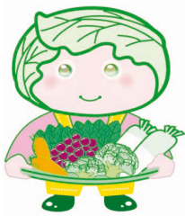
西東京市農産物キャラクター「めぐみちゃん」

都市農地を“宅地化すべきもの”から“都市にあるべきもの”へと転換することで、良好な都市環境の形成に役立てることを目的とした「都市農業振興基本法」が平成27年4月に成