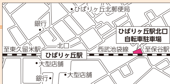
ひばりヶ丘駅北口自転車駐車場 所在地：ひばりが丘北3-1 (地図内)