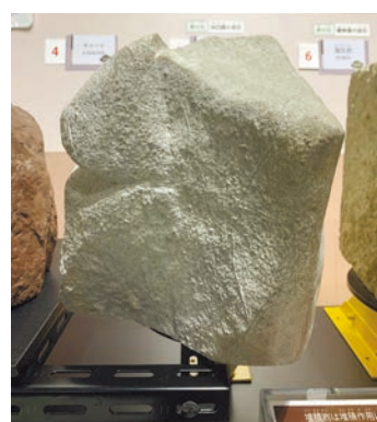
山口県産の石灰岩(地球の部屋)

ートの動きによって移動してきたものです。展示室5地球の部屋で展示している山口県産の石灰岩をよく観察すると、フズリナという古生代の暖かい海にすんでいた生き物の化石が見られます。