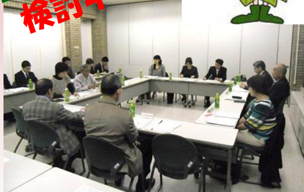
【写真】第5回地域コミュニティ検討委員会の様子 平成24年度初の検討委員会が平成24年4月25日に開催されました。