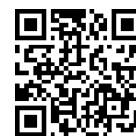
職員採用試験 申込ページ