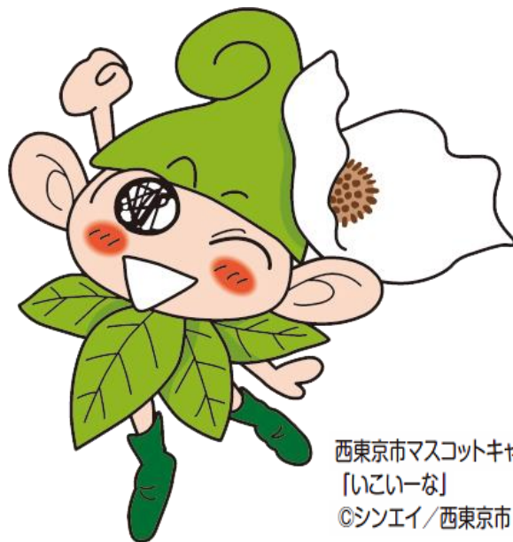
西東京市マスコットキャラクター 「いこいな」