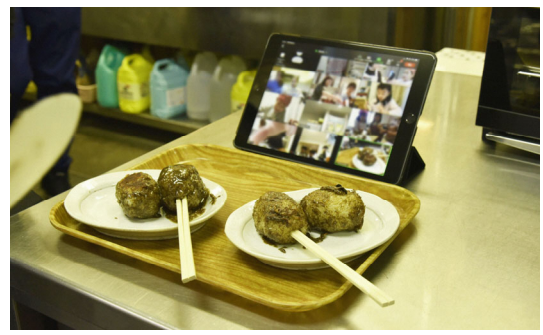
▲福島県南会津郡下郷町とのオンラインによる交流事業