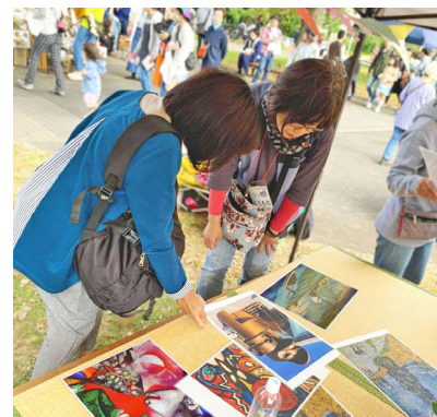
▲市民ボランティアによる 「対話による美術鑑賞」事業