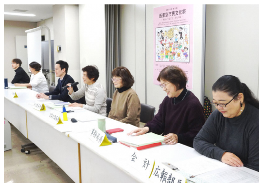
▲市民文化祭運営委員会