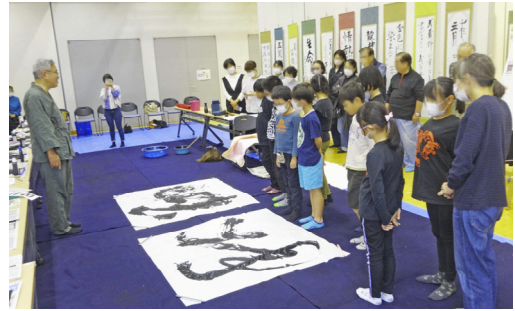
▲「日本の文化体験フェス」in 市民文化祭