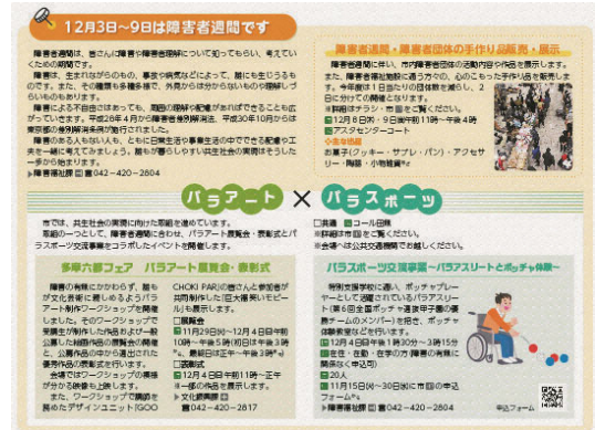
▲複数の分野と連携したイベント