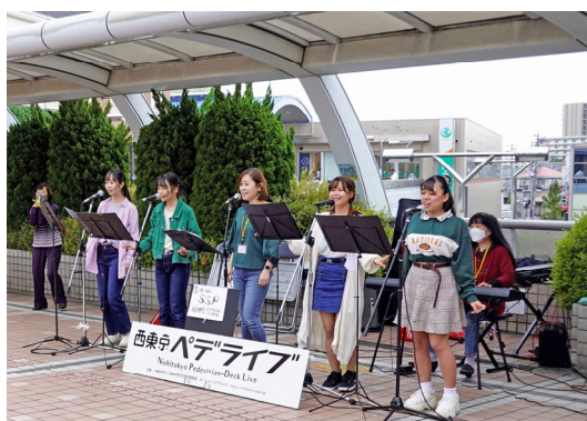
▲活動者による「ペデライブ」 (NPO等企画提案事業)