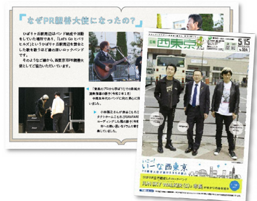
▲PR親善大使と連携した情報発信