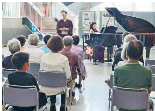
▲無料で鑑賞できる「こもれびフリーライブ」