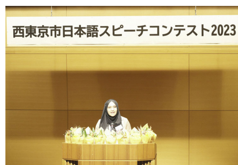
▲日本語スピーチコンテスト