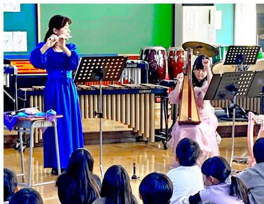
▲指定管理者による小学校へのアウトリーチ事業