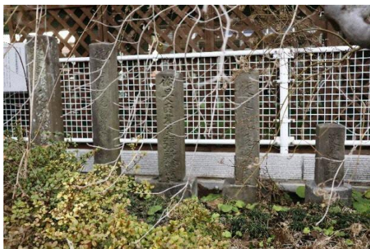
市指定文化財第 32 号 石製尾張藩鷹場標杭