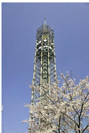
スカイタワー西東京

市の歴史文化を概観すると、水の環境に影響された古い集落の発生と、それらを母体とする旧村の地域ごとの多様な歴史文化が特徴であることがわかります。さらに「武蔵野」「多摩」といった周辺地域も含む広範に共通する要素もあり、重層的な構造が読みとれます。固有の魅力を持つ文化財が紡ぐこの「多様性」と「重層性」が西東京市の歴史文化の特徴です。