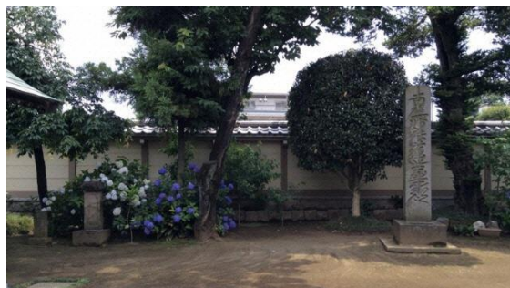
地域の講（かつて南入経塚に建っていた石塔）