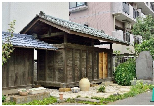
市指定文化財第 4 号 稗倉・ 市指定文化財第 7 号 養老田碑