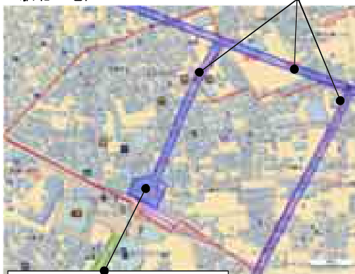
駅前広場（都市計画決定・整備予定）