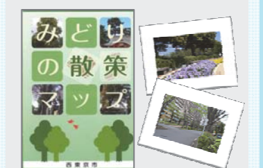
みどりの散策マップ