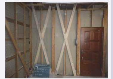
木造住宅耐震改修