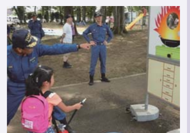
防災市民組織活動