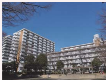
都営柳沢一丁目アパート