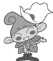
西東京市マスコットキャラクター 「いこいな」 ©シンエイ/西東京市