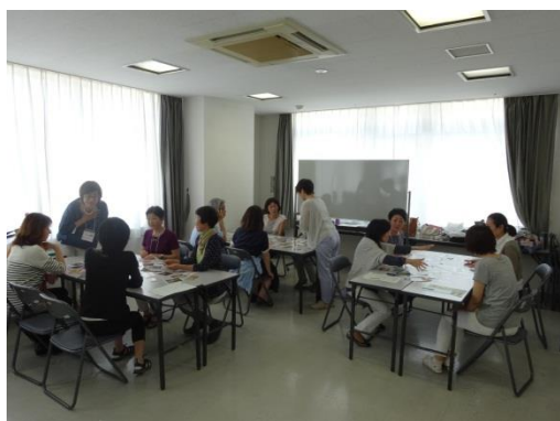
アートカードゲーム体験