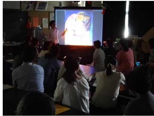
VTS鑑賞(2作品目:先生が鑑賞者)