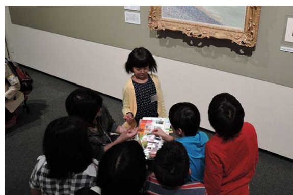
美術館における「対話による美術鑑賞」事業実施風景