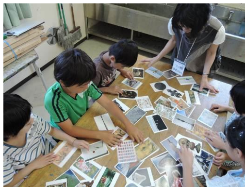
小学校における「対話による美術鑑賞」事業実施風景