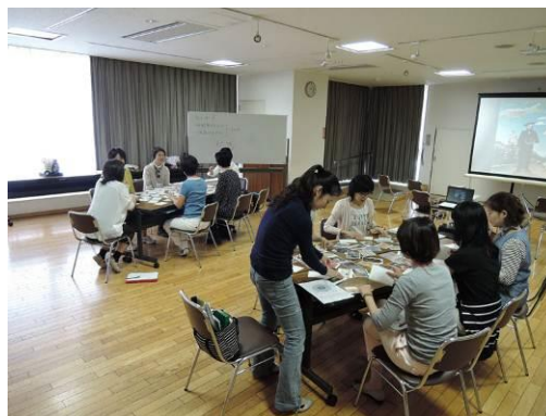
2グループに分かれてアートカード