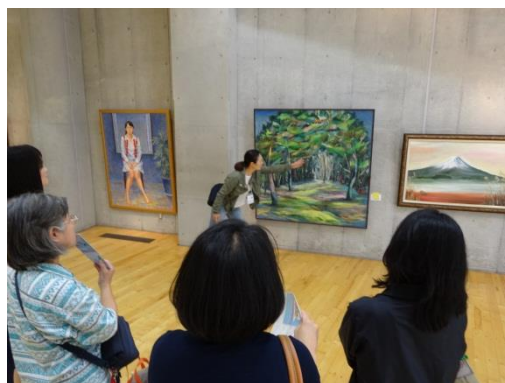
展示作品を使った対話による美術鑑賞