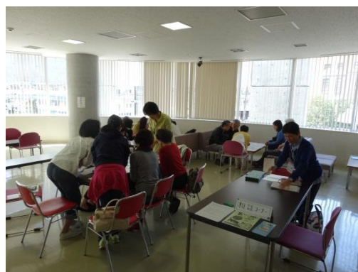
アートカードゲーム体験