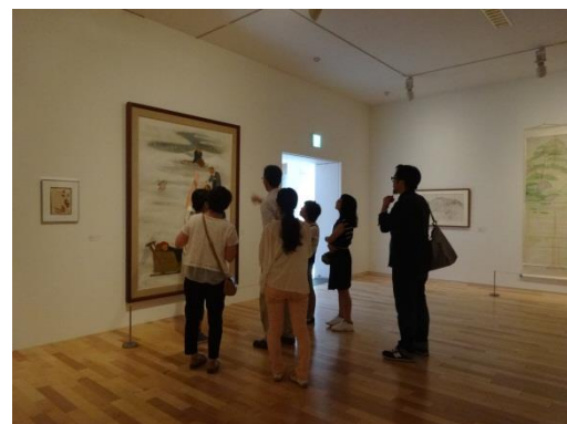
展示作品を使った対話による美術鑑賞