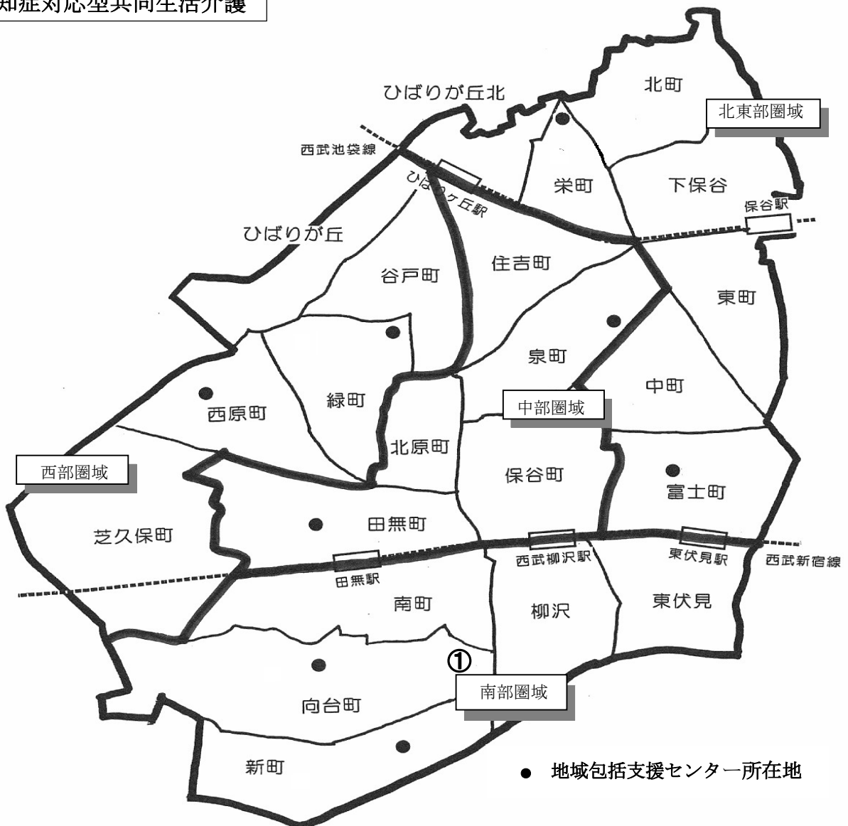
新規指定事業所位置図 ○認知症対応型共同生活介護