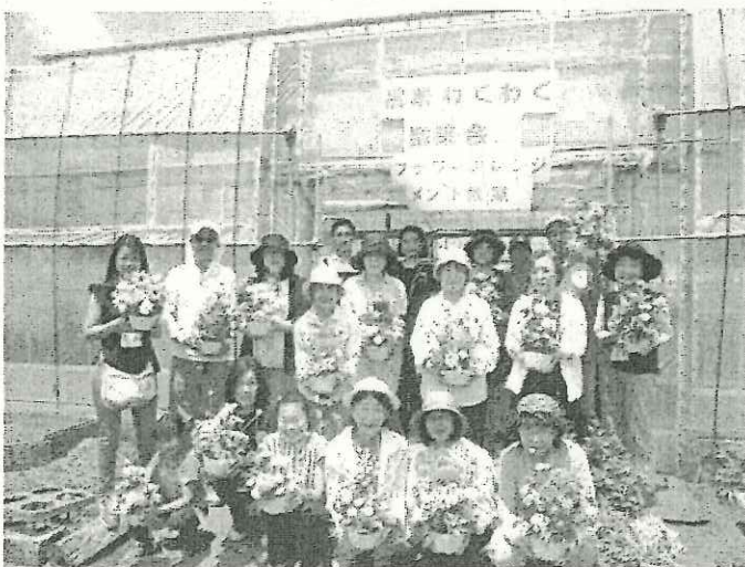
アレンジメント完成！

市では、これからも、市民の皆さんが市内の農業、農地と触れ合える事業を通して、都市農業の魅力をお伝えしてまいります。