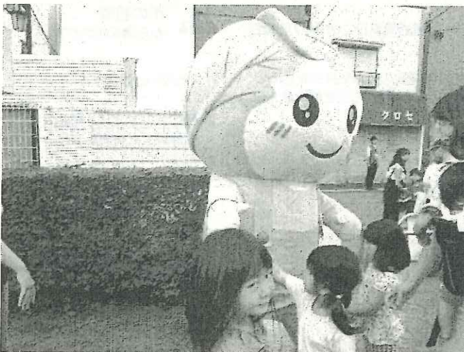
たくさんのお友達とふれあいました！

今回は、めぐみちゃんメニュー事業にご参加いただいている14事業者（11農業者と3商工業者）の方の出品物を販売しました。野菜ではトマトやナス・じゃがいも、加工品ではジャムやクッキー、など今回も多くの農産物や加工品が集まりました。