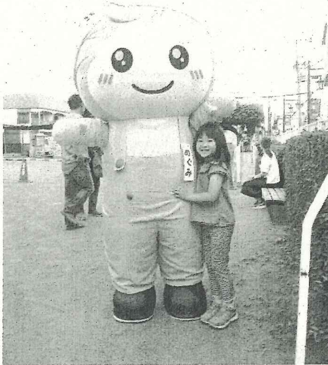
めぐみちゃんもうれしそう！

今後も「めぐみちゃんメニュー事業」をととして、多くの方に西東京市で採れる新鮮な農産物の魅力を知っていただけるよう、各種イベント等を実施し、地産地消の取組を進めてまいります。 また、8月末に第2回「マルシェ・ド・ソフレ」の開催を予定しています。