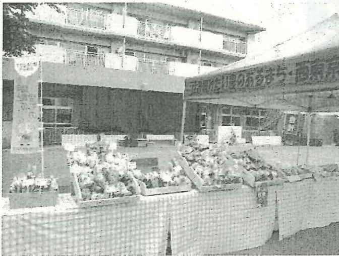
全て安全安心の市内産の農産物です！

市内の畑に夏野菜が顔を見せる季節となりました！ 市内産農産物のおいしさを市民の皆さんにお届けしたい・・・そんな農業者の方の気持ちを込めて、本年度第1回目の「マルシェ・ド・ソフレ」を、6月28日（木曜日）午後5時から西武柳沢駅北口徒歩1分、「保谷第三児童遊園南」において開催しました。 ※地産地消を推進する「めぐみちゃんメニュー事業」の一環として行っています。