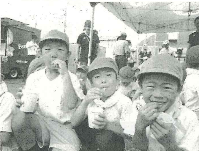
写真5：とれたての「枝豆」のおいしさにみんなの笑顔が輝いていました！