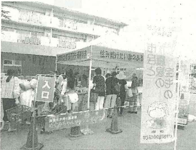
今回も多くの方にご来場いただきました！

今回は、めぐみちゃんメニュー事業にご参加いただいている14事業者（11農業者と3商工業者）の方の出品物を販売しました。野菜ではトマトやナス・じゃがいも、加工品ではジャムやクッキー、など今回も多くの農産物や加工品が集まりました。