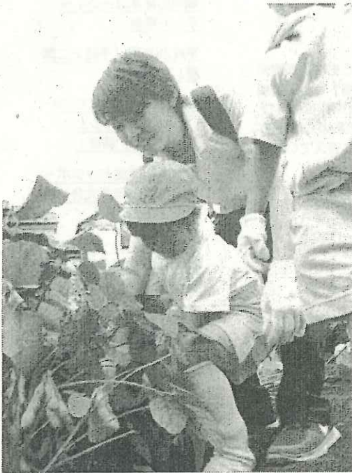
写真4-1,4-2：収穫体験を楽しむ子どもたち。 その後、収穫したての「枝豆」を塩ゆでし、試食しました。