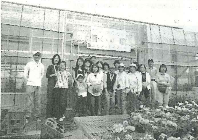
最後は参加者の皆さんが被写体です！

参加者の皆さんは、渡部様にアドバイスをいただきながら一生懸命に撮影をし、「直接プロから撮影技術の指導を受けた後に講評を受ける」という、普段なかなかできない体験を楽しんでいました。