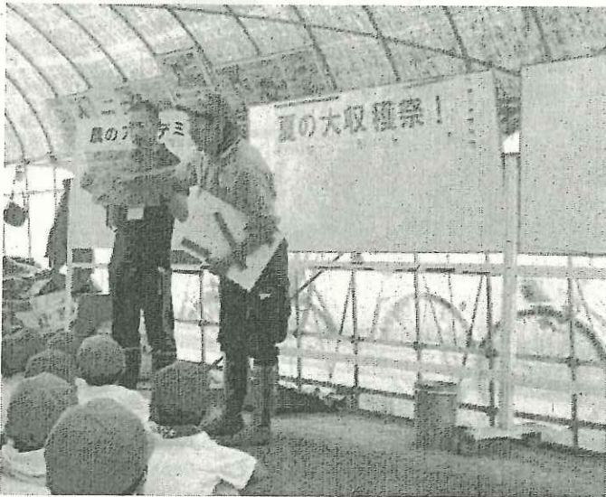
写真2：指導農家さんから、枝豆の成長の経過や収穫方法について説明を受けました。