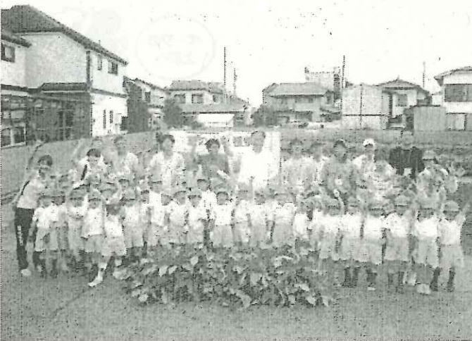
写真6：暑い中、みなさんお疲れ様でした！！