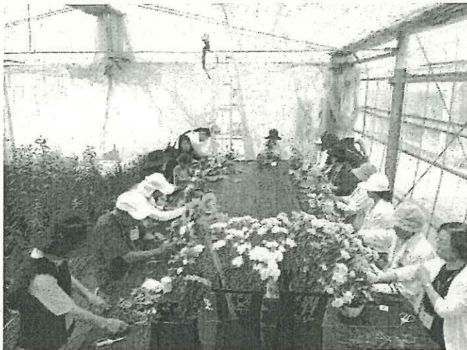
講師の指導を元に、アレンジメントがどんどんできていきます！

園内のお花を摘み取って、自分だけのアレンジメント・ポットを作成しました。 参加者の皆さんは講師の説明を熱心に聞きながら、「自ら摘み取り、その場でアレンジメントを行う」という、新鮮な体験を楽しんでいました。