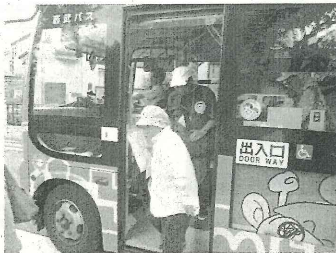
はなバスで保谷駅北口から北宮ノ脇まで移動

6月2日（土曜日）、農業・農地の魅力にふれるイベント「農業わくわく散策会」を、「農あるフォトスクール」及び「フラワーアレンジメント」の2つの内容で実施しました。保谷駅北口からの移動には、市のコミュニティバス「はなバス」を利用し、イベントの実施場所である「花摘みの丘」を訪れました。