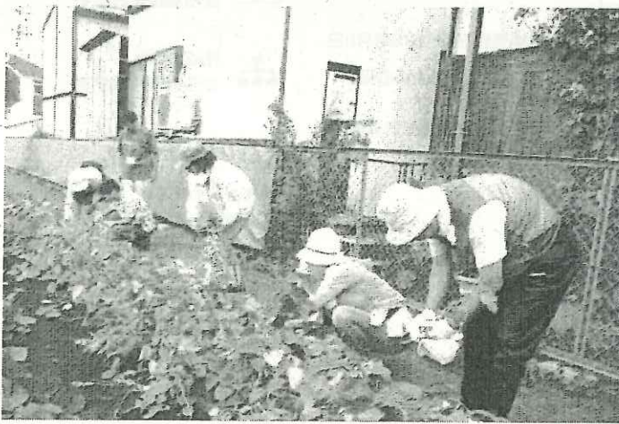
写真3：4月に種をまいた枝豆が立派に育ちました！