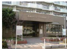
ひばりが丘図書館 講座室