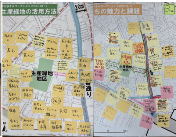
まちづくりワークショップ実施の様子