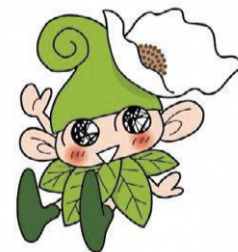
西東京市マスコットキャラクター いこいーな

令和6年3月 西東京市生活文化スポーツ部協働コミュニティ課男女平等推進係 〒202-0005 東京都西東京市住吉町6-15-6住吉会館内男女平等推進センター バリテ TEL:042-439-0075 / FAX:042-422-5375