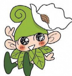
西東京市マスコットキャラクター いこいーな ©シンエイ / 西東京市

令和6年3月 西東京市生活文化スポーツ部協働コミュニティ課男女平等推進係 〒202-0005 東京都西東京市住吉町6-15-6住吉会館内男女平等推進センター バリテ TEL:042-439-0075 / FAX:042-422-5375