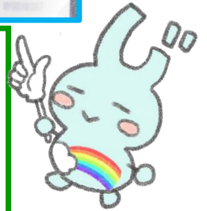
西東京市児童館キャラクター 「にじぽん」